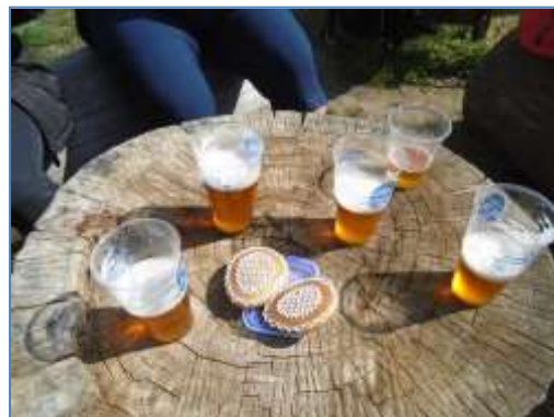
Občerstvení na cestě