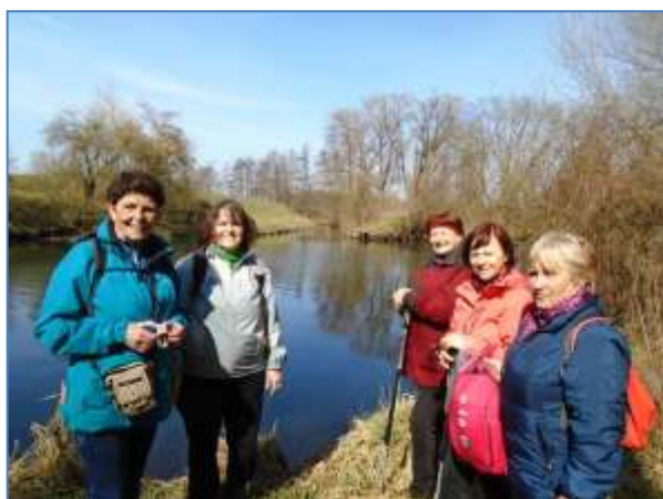
Soutok Svatky s Bobravou

Dvě významné brněnské řeky, Svatka a Svitava, se stékají jižně od Brna u Přízřenic, v sousedství OC Olympia a zábavního parku. Svitava se zleva vlévá do Svatky a zde končí její tok dlouhý 97 km. Svatka dál pokračuje až do vodní nádrže Nové Mlýny na řece Dyji. Z centra Brna vedou podél obou řek cyklotrasy až k soutoku.