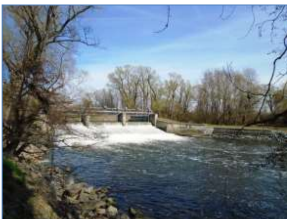
Jez na Svatce