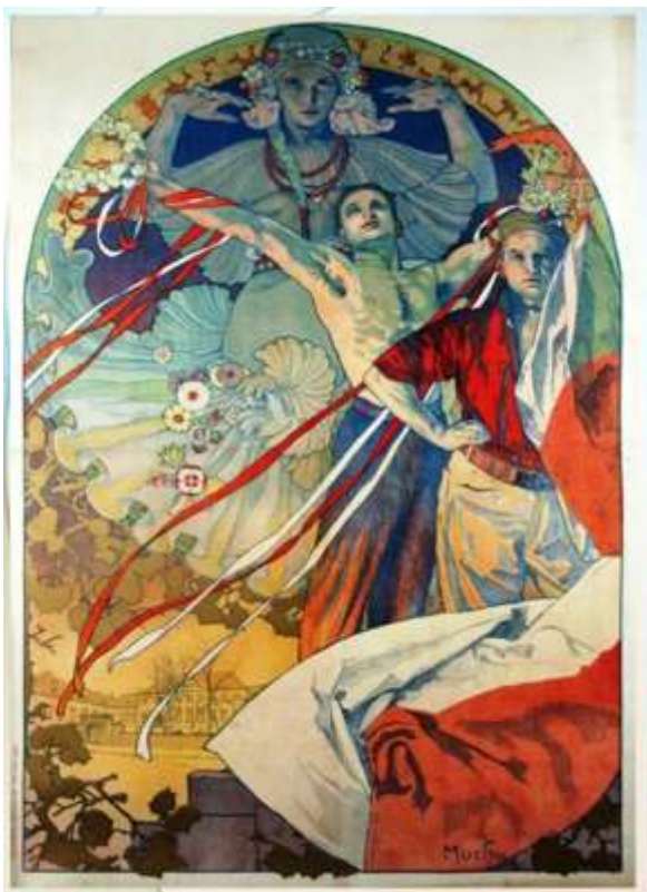
Návrh plakátu Alfonse Muchy

je prakticky to jediné, co se zachovalo z nerealizované podívané roku 1926