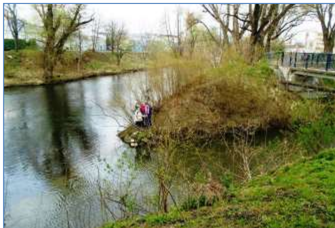
Soutok Svratky a Ponávky v Komárově